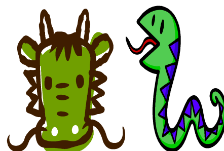
辰年 → 巳年

26日（木）から19日間の冬季休業になります。年末年始は家族での時間を大切にしながら、新しい年に向けて希望をもてるように、家庭での会話を多くしていただくと幸いです。通知表に記載された学級担任のメッセージをしっかりと受け止めて、休み中や3学期の過ごし方に生かしていただけるようお願いいたします。また、年末年始は人の移動が多くなり、感染症拡大の恐れがあります。状況に応じた感染症対策（手洗い・手指消毒やマスク着用、十分な睡眠・栄養等）をお願いいたします。生徒や御家族の皆様が健康でよいお年を迎えられることをお祈りしています。